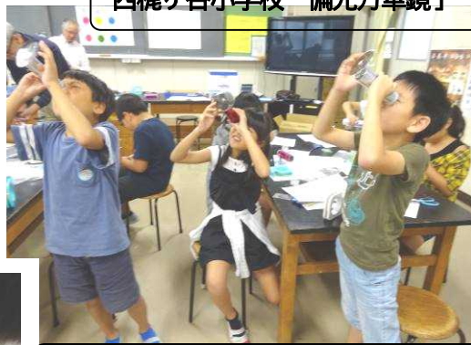
東住吉小学校「ブンブン回転そうち」